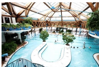
Kur und Freizeitbad „RIFF“