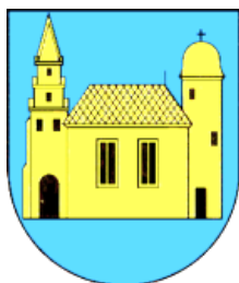
Wappen der Stadt Bad Lausick